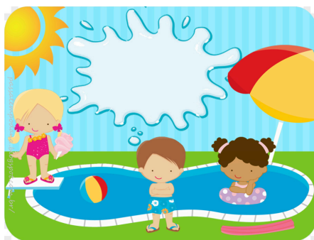
Ir a la piscina