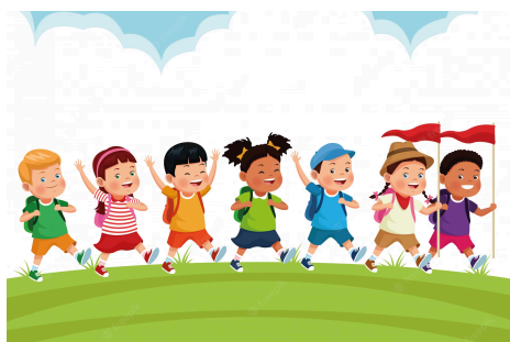
Salir de excursión